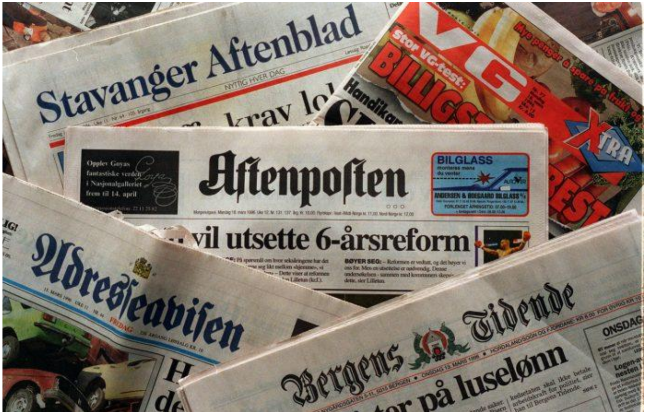
Norske aviser.

Tre forskere har sett på vår publiseringspraksis og har ifølge Klassekampen kommet til at «Resett ikke bryter med presseetikken, verken på nyhetsplass eller i kommentarfeltet».