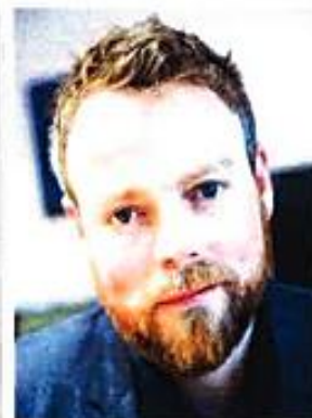
Kunnskapsminister Torbjørn Røe Isaksen (H) leter etter årsaker.

• Høgskolen i Oslo og Akershus vil gjennomføre en modell for identifisering, kartlegging og