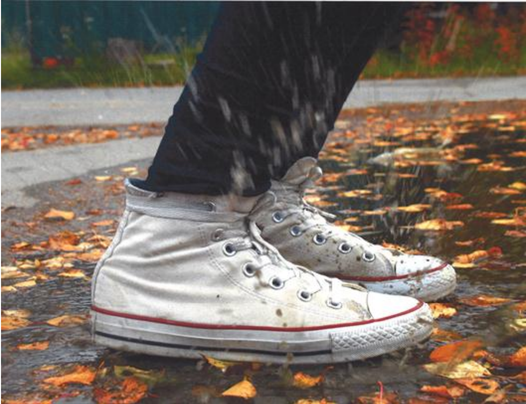
Govva: Mediat ja gulahallan 2015/16