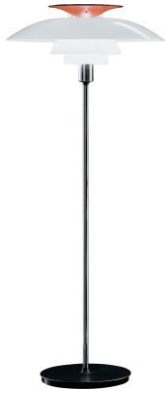
PH 80 gulvlampe fra Louis Poulsen