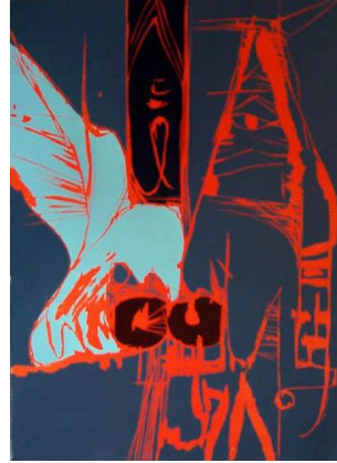
Magne Furuholmen: Everything happens to me (76x56)