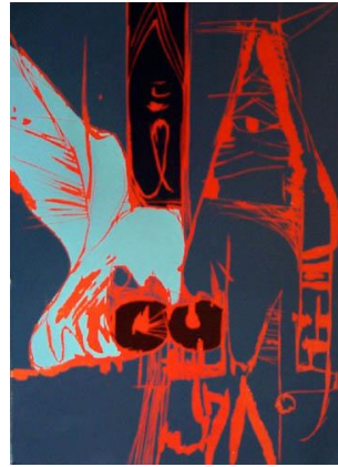
Magne Furuholmen: Everything happens to me (76x56)