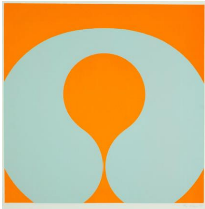
Per Kleiva: Utopia (60x60)