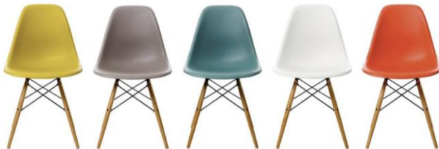
Stoler fra Eames DSW.