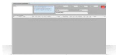
☆ Vigomeny inntak Sentralbase - 12 Hordaland.qvw

Det er laget en egen kontroll i QlikView for effektiv kontroll av fag. Dere finner den under QlikView – AccessPoint og på dette ikonet: